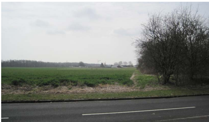
Forslag til placering af parkeringsplads og overkørsel, set fra Sydskellet.