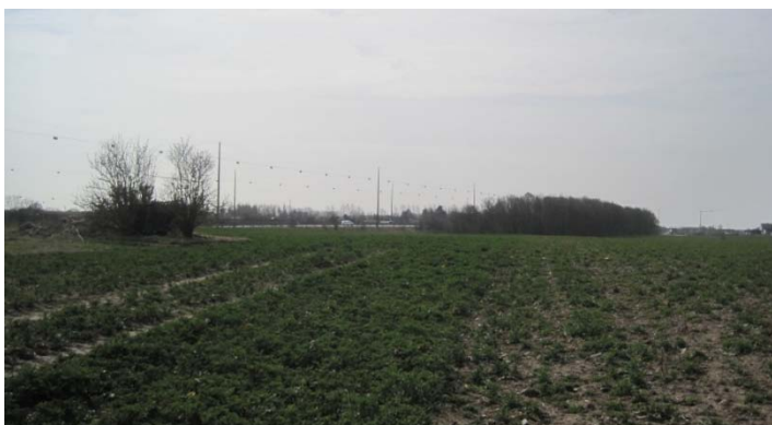
Lokalplanområdet set fra Sydskellet.

Området ligger i kommunens sydøstlige hjørne, lige syd for Sydskellet og grænsende op til motorvejen mod øst og Røjlegrøften og Ishøj Kommune mod syd.